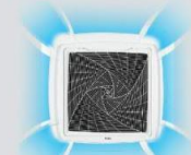
Unique round way air flow design