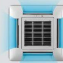
4 way airflow

มีสไลด์ด้วยระบบกระจายความเย็นรอบตัวทำให้สบายทุกมุมห้องโดยไร้จุดอับความเย็น หน้ากากขนาด กxลxส 950x950x60 (18-48k)